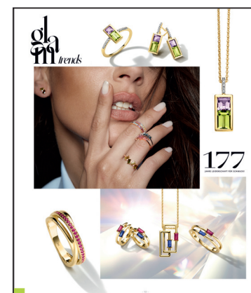
SEITE 10 komplett individualisierbar