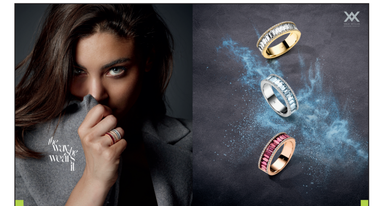
SEITE 6 komplett individualisierbar