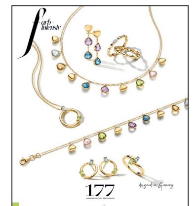
SEITE 14 komplett individualisierbar