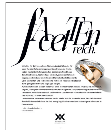
SEITE 3 komplett individualisierbar

Diese 6 Seiten können Sie durch Ihre individuellen Seiten, Angebote und Texte ersetzen: